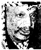
YASSER ARAFAT Lider palestino

El presidente de la Autoridad Nacional Palestina (ANP), Yaser Arafat (65), fue recibido ayer por vez primera con honores de jefe de Estado en la Casa Blanca. El presidente norteamericano, Bill Clinton, subrayó la fidelidad y firmeza del líder palestino en su compromiso con el difícil proceso de paz en Oriente Medio. PÁGINA 8