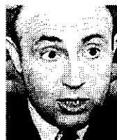
LUIS ROLDÁN Ex dtor. de la Guardia Civil