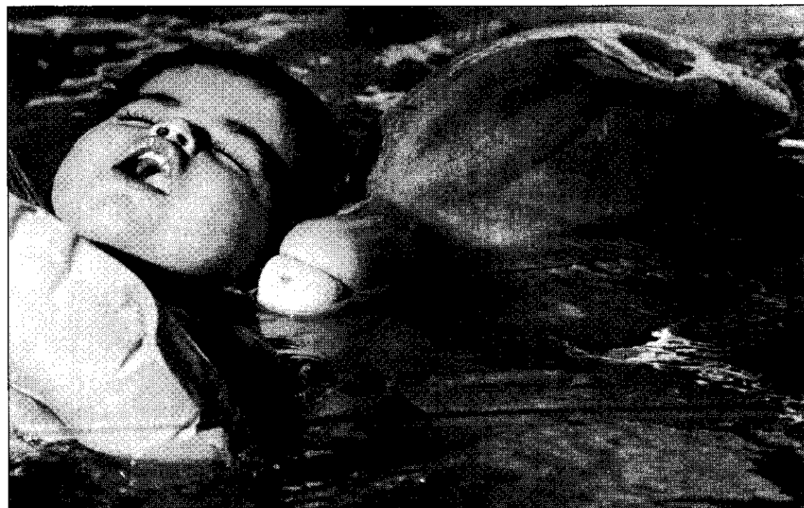
Una niña con retraso mental durante el tratamiento de terapia con delfines en el acuario de Ciudad de México.